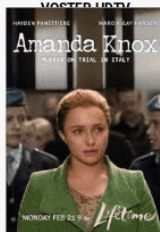
Les deux visages AMANDA KNOX FRENCH