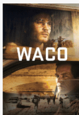
Waco S01E01 VOCTED UNTV