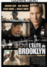
L'Elite de Brooklyn FRENCH DVDRIP 2018