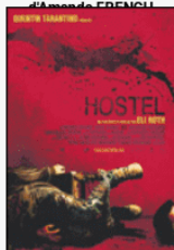
Hostel DVDRIP VO 2005