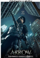
Arrow S05E02 VOCTED UNTV