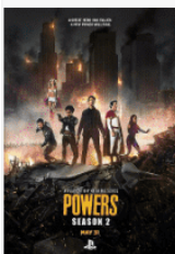
Powers S02E02 FRENCH HDlight